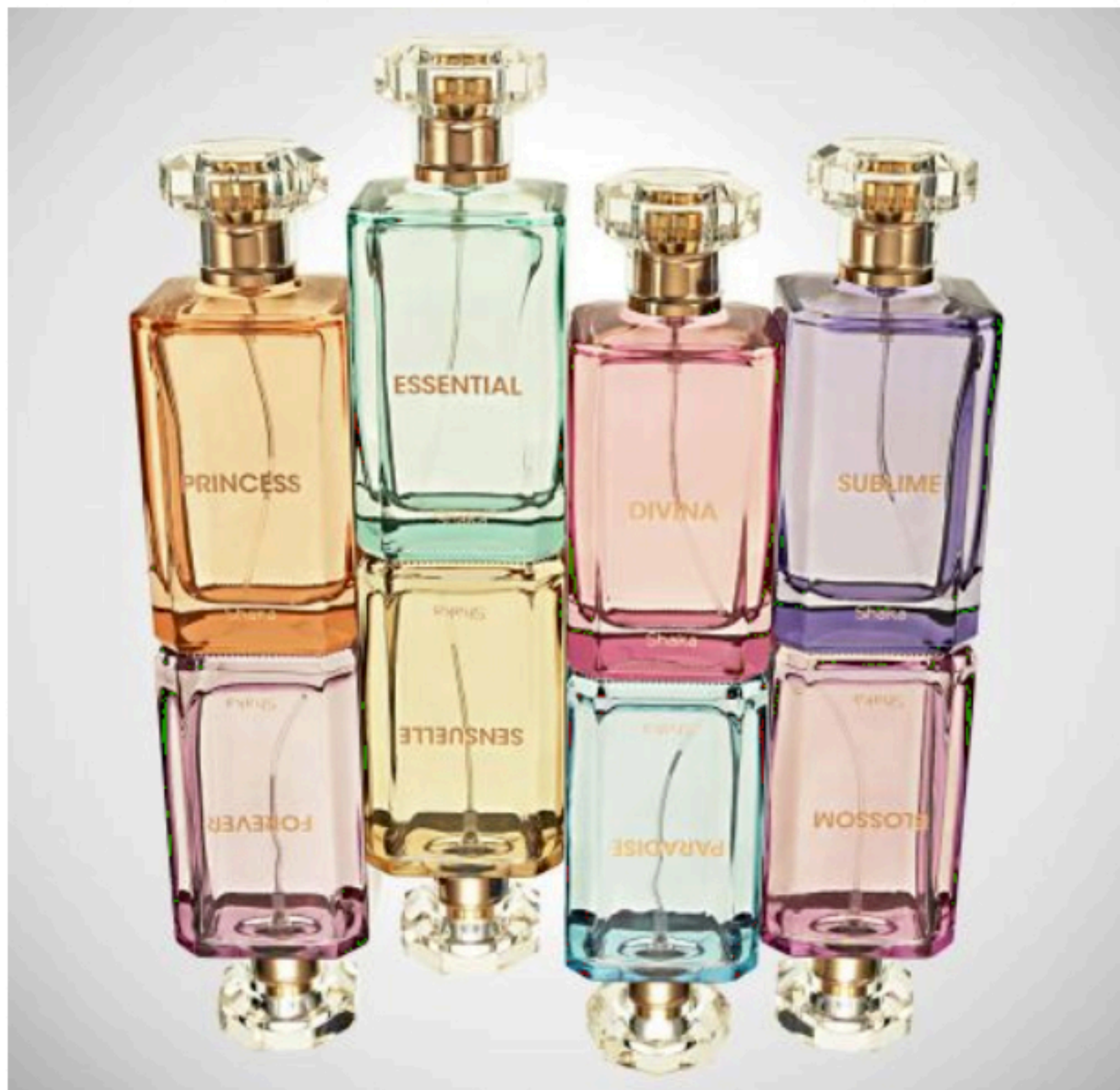
Profumi Shaka Innovative Beauty

Shaka Innovative Beauty lancia la sua nuova linea di profumi prêt-à-porter, pensata per tutte le donne che amano sperimentare ed indossare fragranze che le facciano sentire speciali in tutti i momenti della giornata. Le otto profumazioni, costruite attorno alle note più famose della profumeria, sono state realizzate in partnership con Icr eccellenza nel settore della profumeria e della cosmetica selettiva.